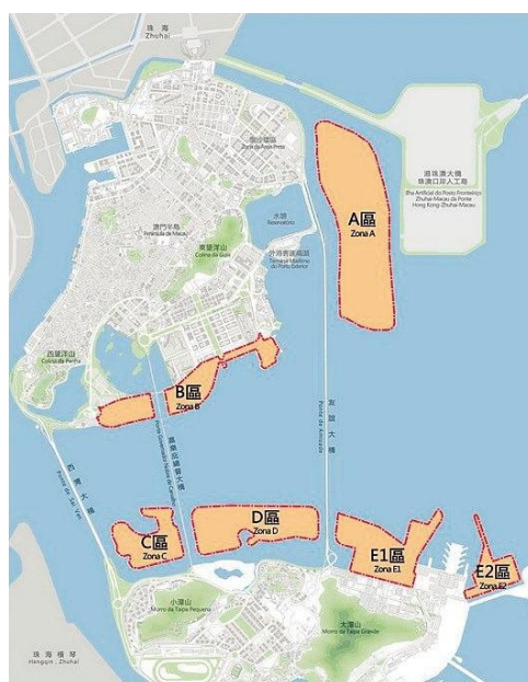
圖 2 澳門新城區區位示意圖

四是特區政府於 2006 年提請中央政府考慮審批澳門適度填海建設新城，2008 年正式向中央政府提出填海申請，2009 年 11 月國務院正式批覆，同意澳門特區填海造地 361.65 公頃，後修訂為 350 公頃。如圖 2 所示，澳門新城區位於澳門東、南沿岸及氹仔北岸，由五幅填海地段組成，面積約相當澳門總面積九分之一。