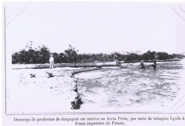
圖1 1923年，在馬交石一帶進行填海工程，造成黑沙環的大片土地

歷史上，澳門曾經歷多次大規模的填海工程，相較於今天透過填海造地解決土地緊缺問題，19世紀末至20世紀初的填海計劃，目的集中於改造港口，土地的增加是計劃的副產品。19世紀末至20世紀初的一系列計劃及工程雖然改善港口，但是澳門已無法恢復昔日的海港地位。填海而成的土地，起初只用於農業耕作，後來卻成為了城市的組成部分，並為澳門20世紀下半葉的城市發展提供了土地資源。 3 如圖1所示，現時的黑沙環部份用地正是由此而來。