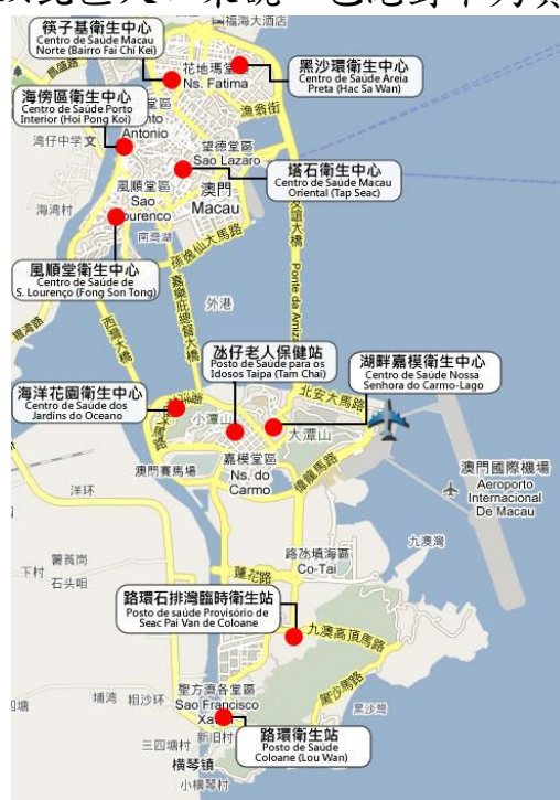
圖 3 澳門衛生中心及衛生站分佈示意圖

4.醫療問題：澳門現時只有一所公立醫院，即仁伯爵綜合醫院，衛生中心共有 7 間及 3 所衛生站。 2 因土地制約，本澳一直缺乏大型醫療綜合體，因興建需達國際指標，在澳門半島興建難以實行，社會一直呼籲興建離島醫院，以滿足醫療服務長遠需要，但離島興建又與旅遊博彩用地相競爭。在衛生中心方面，就以北區人口來說，也絕對不夠負荷的。